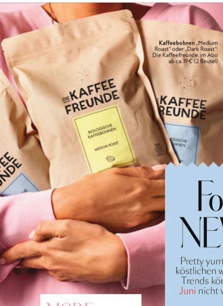
Kaffeebohnen „Medium Roast“ oder „Dark Roast“: Die Kaffee Freunde, im Abo ab ca. 19 € (2 Beutel)