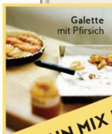
Galette mit Pfirsich